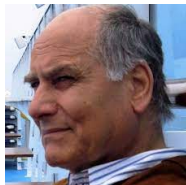
Fabrizio Cinti Architetto

Il percorso verrà introdotto e accompagnato da alcuni esperti con serate specifiche e sarà sviluppato con l'intento di raccontare il viale come cerniera che unisce i quartieri di Jesi (dal più popolare a quello più residenziale).